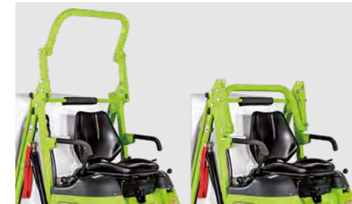
klappbarer Überrollbügel serienmäßig